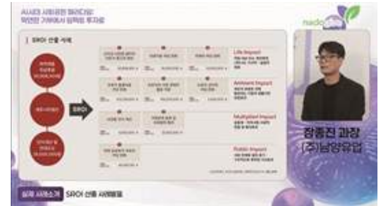
사회적가치 측정 세미나 참여