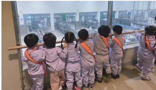
천안공장 견학 사진