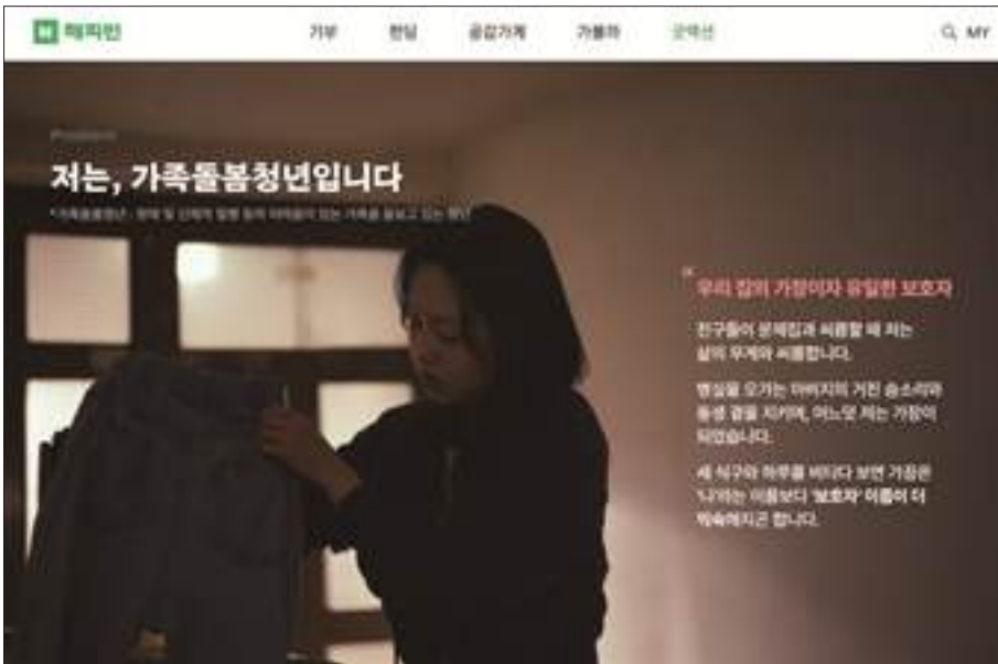
네이버 해피빈 굿액션 캠페인 페이지

남양유업x네이버 해피빈 가족돌봄청년 통합지원 캠페인에는 지난 2024년 남양유업과 월드비전 가족돌봄청년 필 케어 사업을 통해 유의미한 변화를 확인했던 두 청년의 실제 사례를 담았습니다. 그 결과 총 12만이 넘는 페이지뷰, 캠페인배너 클릭 9만 9천회를 기록하였으며 캠페인 기간 동안 네이버 기부공을 통한 참여자 수 39,838명, 가족돌봄청년에 대한 진심이 담긴 소비자 응원 댓글이 6,971건 발생하는 등 캠페인을 성공적으로 마무리했습니다.