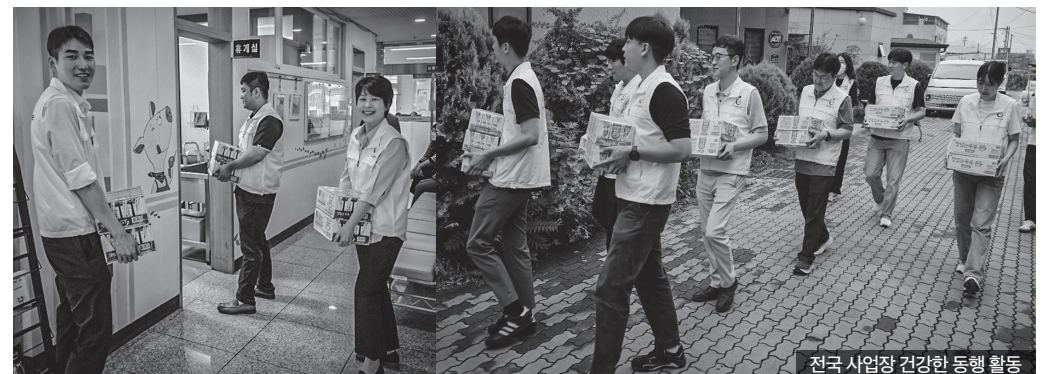
전국 사업장 건강한 동행 활동